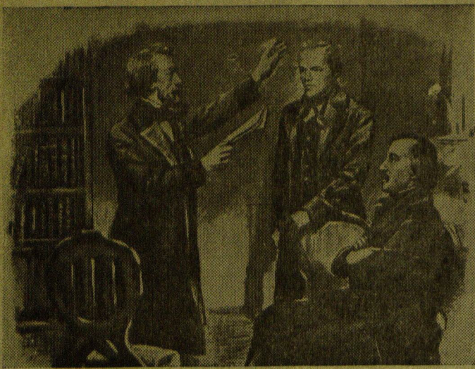
В. Г. Белинский, Ф. М. Достоевский и Н. А. Некрасов.

С 25 мая по 1 августа 1948 г. Пятигорская центральная сберкасса № 30 приступает к обмену облигаций и свидетельств за неиспользованный отпуск, в связи с конверсией государственных займов. Обмен будет производиться в центральной сберкассе № 30 (Сакко-Ванцетти, № 2) и в сберкассе № 30/03 на Провале с 8 часов утра и до 14 часов дня ежедневно (кроме воскресенья), а также на предприятиях и учреждениях по графику, утвержденному исполкомом. Сберкасса № 30.